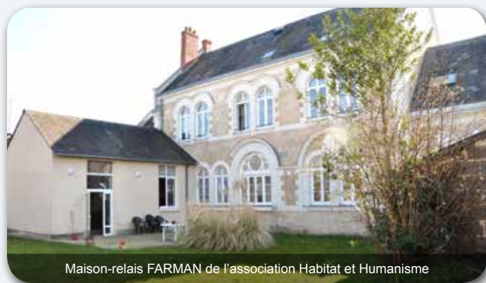
Maison-relais FARMAN de l'association Habitat et Humanisme

Il développe une mission d'observation des publics afin d'appuyer l'adaptation de l'offre au besoin.